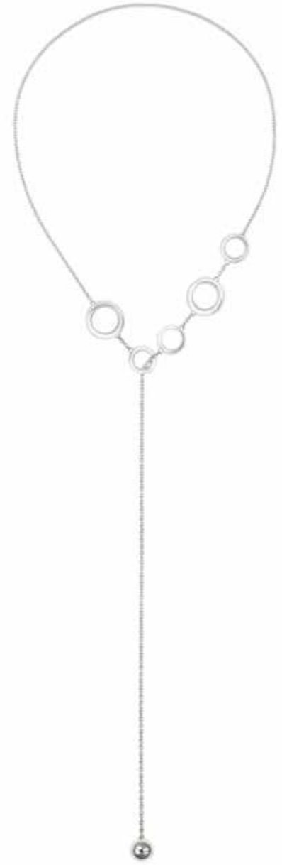
B06700208 L : 69 cm - 27 1/2" Sautoir 5 anneaux Long necklace with 5 rings