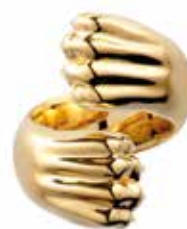
Bague croisée Curling ring

B06765249 T.49 5" B06765251 T.51 5 2/3" B06765253 T.53 6 1/3" B06765255 T.55 7" B06765257 T.57 8" B06765259 T.59 8 2/3"