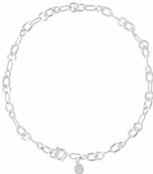
Collier chaîne Chain necklace