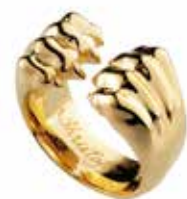
Bague ouverte Open ring

B06765049 T.49 5" B06765051 T.51 5 2/3" B06765053 T.53 6 1/3" B06765055 T.55 7" B06765057 T.57 8" B06765059 T.59 8 2/3"