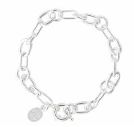
Bracelet chaîne Chain bracelet