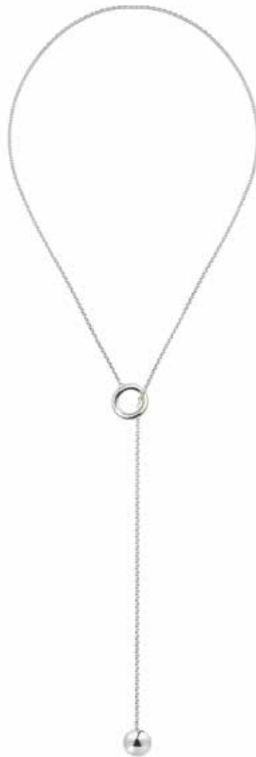
B06700207 L : 60 cm - 23 5/8" Collier cravate Necklace tie